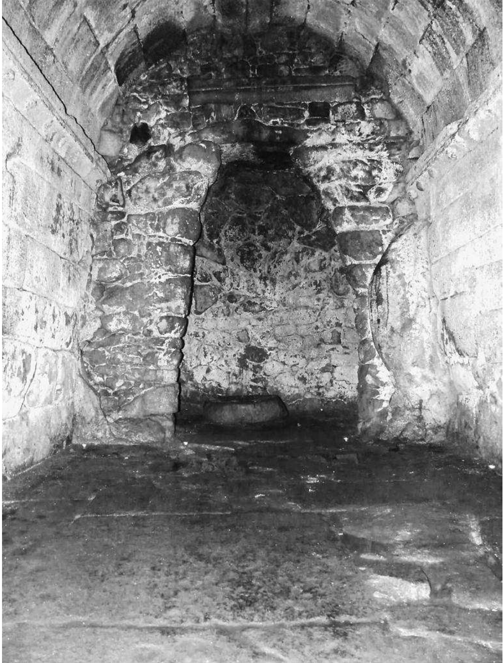
Figura 1. Santa Marina de Aguas Santas: 'Forno da Santa' en el laconicum conservado en la cripta de la iglesia.